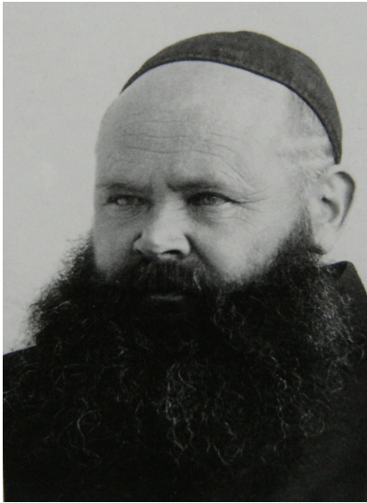
P. Ludgerus Leonard. [Cyrill SCHÄFER (2005), p. 50.]

triennium renovaverunt. 11 Hunc in modum fundamentum ponebatur, quo deinde opera sequentia effici potuerunt.